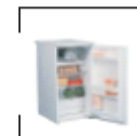
Frigaro versch. Größen St. ab € 88,-