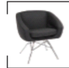
Aiko anthrazit, weiß, grau, rot St. € 119,-