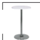
Amato 110 weiß, schwarz St. € 57,-