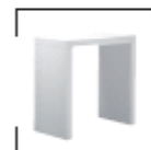
Levante versch. Größen weiß, schwarz St. ab € 148,-