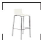
Ginny weiß, schwarz St. € 33,-