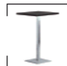
Roana 110 schwarz, weiß St. € 70,-