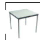
Medola versch. Größen weiß, schwarz St. ab € 38,-