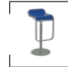
Lem , blau, weiß, schwarz, rot, grün, gelb St. € 74,50