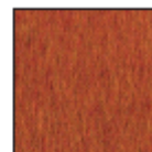
Salinas m 2 € 7,90

Weitere Farben bieten wir gerne auf Anfrage oder auf www.jmt.de .