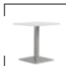
Roana 70 weiß, schwarz St. € 65,-