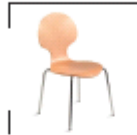
Bunny natur, weiß, schwarz, rot St. € 32,-