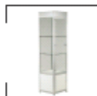
Griante versch. Größen St. ab € 245,-