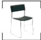
Asti anthrazit St. € 23,50