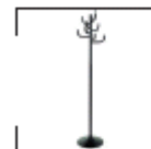
Acri schwarz, weiß, chrom St. € 31,-