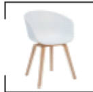
Amagni weiß, schwarz St. € 49,50