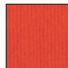
Xporips m 2 € 10,50

Weitere Farben bieten wir gerne auf Anfrage oder auf www.jmt.de .