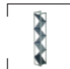
Cori schwarz, weiß, blau St. € 93,-