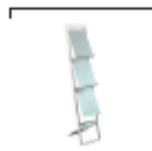
Campo St. € 59,-