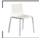
Catifa weiß, schwarz St. € 37,-