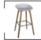
Amagni Bar weiß St. € 49,50