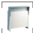
Infocounter grau St. € 172,-