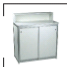
Bari Top weiß St. € 171,-