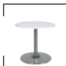
Amato 70 weiß, schwarz St. € 49,50